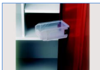
Détail de la boîte sur la porte