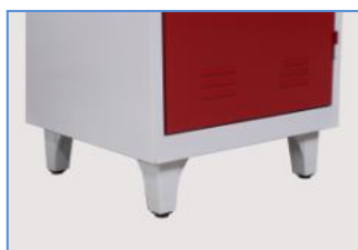
Détail des pieds