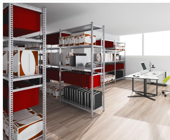
Exemple de Montage