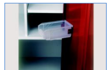
Détail de la boîte sur la porte