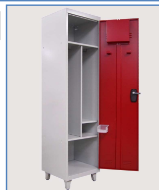
Détail du réceptacle boîte à lettre