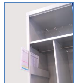
Détail fente boîte à lettre