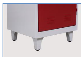
Détail des pieds