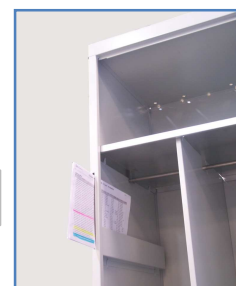
Détail fente boîte à lettre