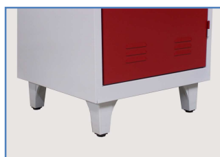
Détail des pieds