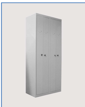
Modèle 2 colonnes : 4 cases