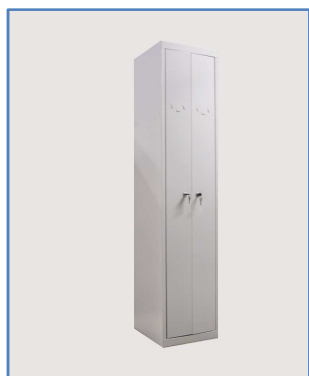
Modèle 1 colonne : 2 cases