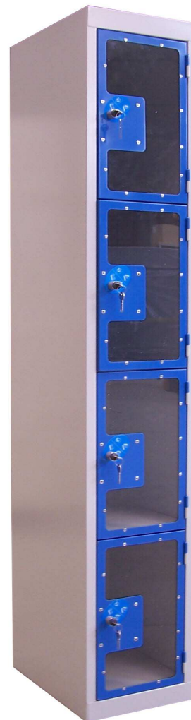
Meuble 1 colonne de 4 cases

Tablettes intermédiaires en tôle galvanisée à chaud, non peintes.